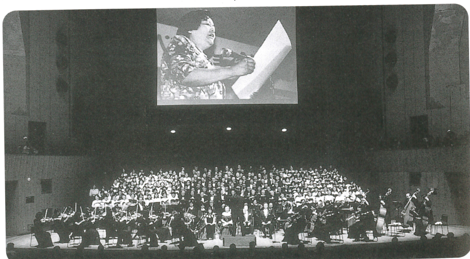
吉田裕史指揮、東京交響楽団メンバーによるモーツァルトの《レクイエム》

各地のピアノ指導者の組織化、社団法人化をはじめ、コンクール、セミナーの開催、そして新たに生涯学習へと、その活動の輪を広げていくピティナ。このピティナを全国に129支部、8000人の会員を擁する世界最大規模のピアノ指導者団体につくりあげたのは、まぎれもなく故福田靖子氏の力による。その偉大な業績は故人の遺志とともにあらたな世紀を迎え、さらに未来へと引き継がれようとしている。